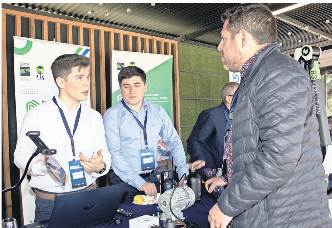
Demostración de tecnologías desarrolladas en proyecto FIC Manufactura Avanzada: Mayor Productividad en pymes. GORE Biobío.