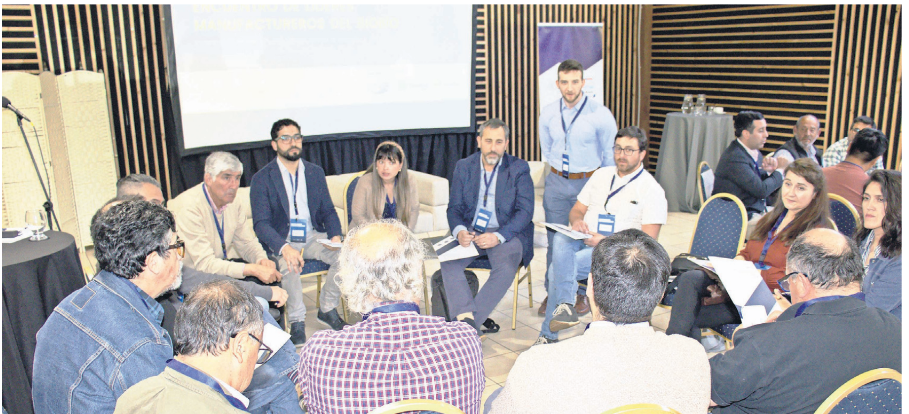
El encuentro reunió a importantes actores del ecosistema industrial de la Región del Biobío.